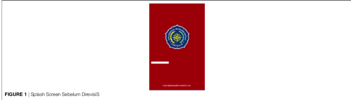
FIGURE 1 | Splash Screen Sebelum DirevisiS