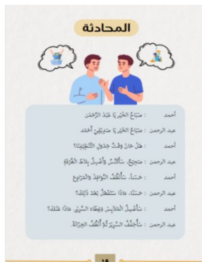
Gambar 7. Muhadatsah