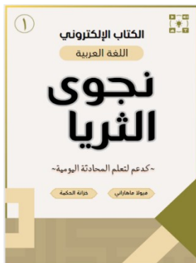
Gambar 2. Cover E-Book Najwa Tsurayya