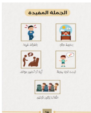
Gambar 6. Jumlah Mufidah