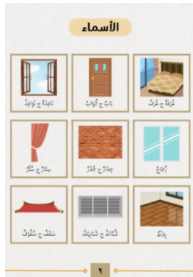
Gambar 4. Mufrodat Terkait Isim/Kata Benda