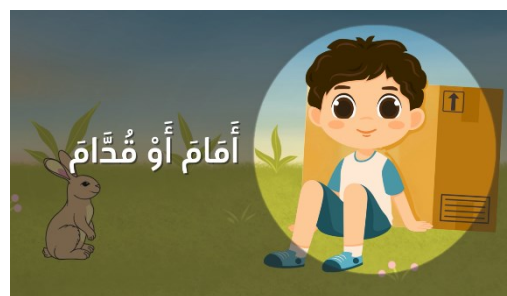
Gambar 12. Kosa Kata yang Dihadirkan dengan Ilustrasi Gambar Menarik/Animasi Sederhana