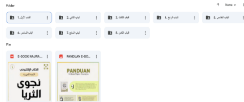
Gambar 10. Isi dalam Barcode