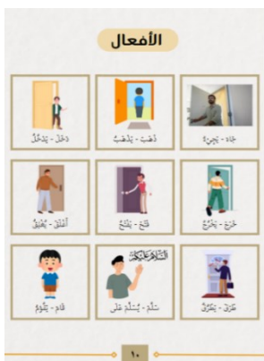
Gambar 5. Mufrodat Terkait Fi'il/Kata Kerja