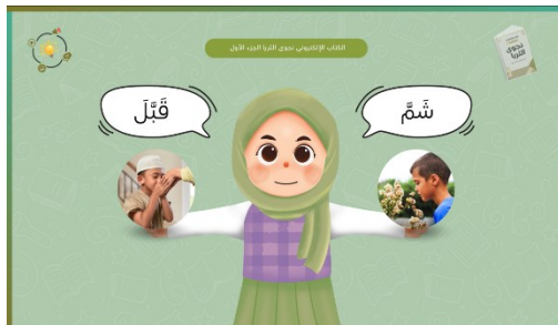
Gambar 13. Contoh Perbandingan 2 Kosa Kata Serupa