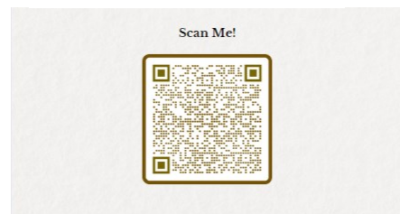
Gambar 9. Barcode