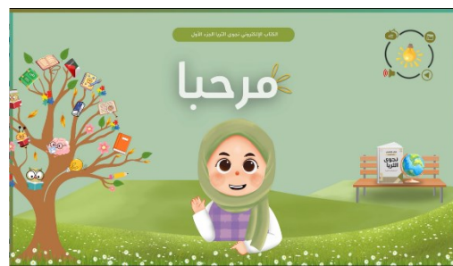
Gambar 11. Cover Video Pembelajaran