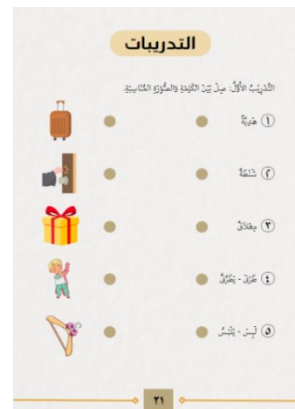
Gambar 8. Tadribat