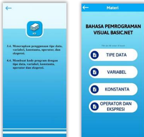
Gambar 3 Menu KD dan Menu Materi

Tampilan menu KD dan materi ditunjukkan pada Gambar 3 .