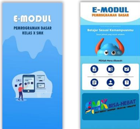
Gambar 2 Tampilan Awal Media

Tampilan awal media ditunjukkan pada Gambar 2 .